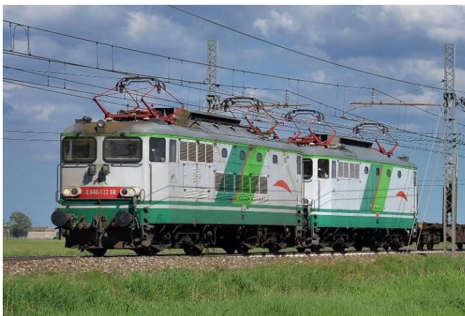
Barvna shema italijanskega prevoznika Ferrovie Emilia-Romagna (FER).