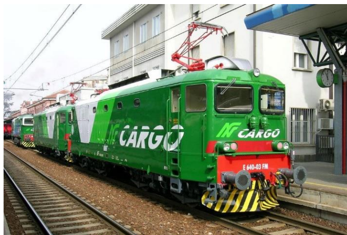
Barvna shema italijanskega prevoznika Ferrovie Nord Milano (FNM).

E640 03 FM (ex 342-033) Italija 20.03.2004